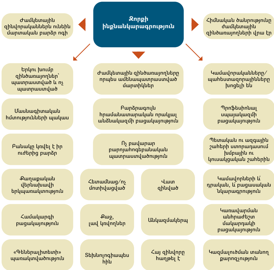
Դիագրամ 2. Զորքի ինքնանկարագրություն՝ քարտեզագրում