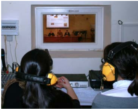
ԵՊԼՀ Թարգմանչական լաբորատորիայի ուսանողները իրենց հմտություններն են ցուցաբերում Լաբորատորիայի պաշտոնական բացման ժամանակ

զ) առանձին դիտարկումներն առ այն, որ համալսարանում չկան լայն տարածում ունեցող մանր կոռուպցիոն դրսեւորումներ.