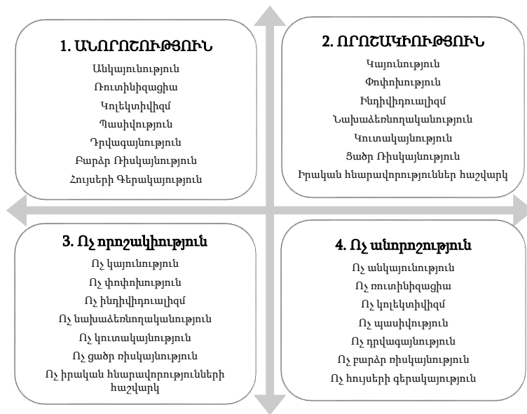
Գծապատկեր 2. Պրեկարային աշխատանք կատարող երիտասարդների ապագայի պլանավորման պրակտիկաները նկարագրող իմաստային քառակուսի

ստացվում է պրեկարային աշխատանք կատարող երիտասարդների ապագայի պլանավորման պրակտիկաները նկարագրող իմաստային քառակուսին, որը հիմք է ծառայում որակական տվյալների վերլուծության համար: